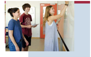
Die gymnasiale Oberstufe und die Abiturprüfung